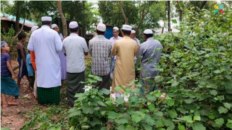
(ပုံ) ကုတုပလောင် ဒုက္ခသည်စခန်းတစ်နေရာတွင်ရှိသော မိုဟင်ဘူလ္လာနောက်ဆုံး လဲလျောင်းရာ ကဗရ်။