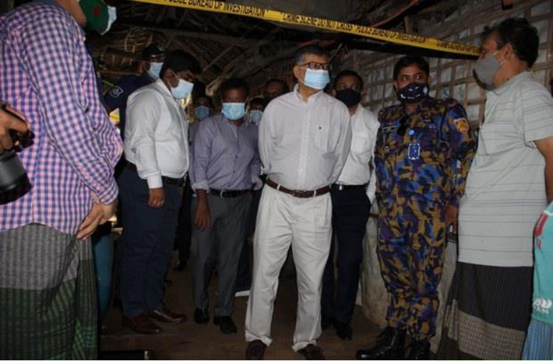
(ပုံ) ဘင်္ဂလားဒေ့ရှ် နိုင်ငံခြားရေးဝန်ကြီးဌာနအတွင်းဝန် မာဆုတ်ဘင်မိုမန်(အလယ်) ဒုက္ခသည်စခန်း၌ မိုဟစ်ဘူလ္လာလုပ်ကြံခံရသည့်နေရာကို လာရောက်ကြည့်ရှုကာ သူ့ မိသားစုဝင်များနှင့် တွေ့ဆုံမေးမြန်းနေစဉ်။ ၂၀၂၁ခု အောက်တိုဘာလ ၉ ရက်။