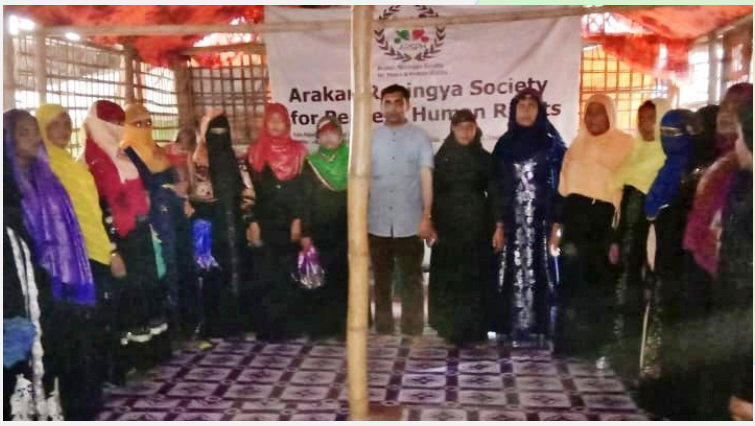
(ပုံ) ARSPH ၏ စိတ်ဓာတ်မြှင့်တင်ရေးယူနစ်မှ ဒုက္ခသည်အမျိုးသမီးများနှင့်အတူ မိုဟစ်ဘူလ္လာကို တွေ့ရစဉ်။