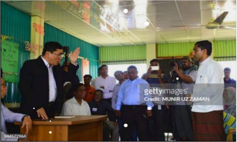
(ပုံ) လူကယ်ပြန်ဝန်ကြီး ဒေါက်တာဝင်းမြတ်အေး စခန်းသို့ လာရောက်စဉ် မိုဟစ်ဘူလာနှင့် တွေ့ဆုံမေးမြန်းနေပုံ။ ၂၀၁၈ ခု ဧပြီလ။