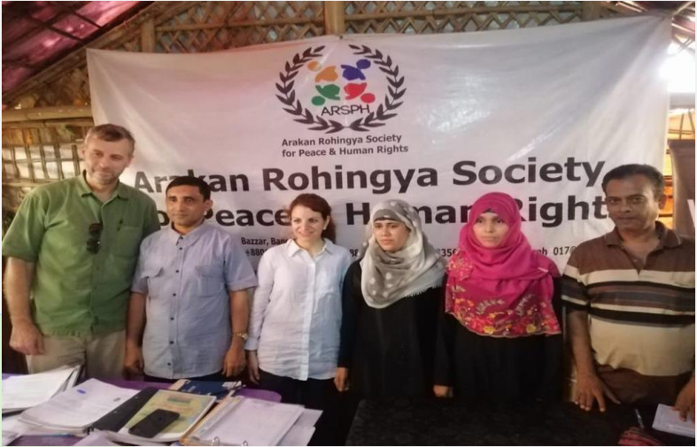
(ပုံ) အမေရိကန်ပညာရှင်များအဖွဲ့နှင့် ARSPH ရုံးတွင် တွေ့ဆုံစဉ်။ ၂၀၁၉၊ ဇူလိုင်လ။