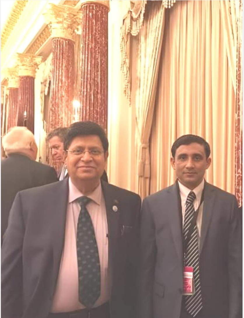
(ပုံ) ဘင်္ဂလားဒေ့ရှ်နိုင်ငံ နိုင်ငံခြားရေးဝန်ကြီး ဒေါက်တာ အေကေ အဗ္ဗဒုလ်မိုမန်နှင့် မိုဟင်ဘူလ္လာ တွေ့ဆုံစဉ်။ ၂၀၁၉။