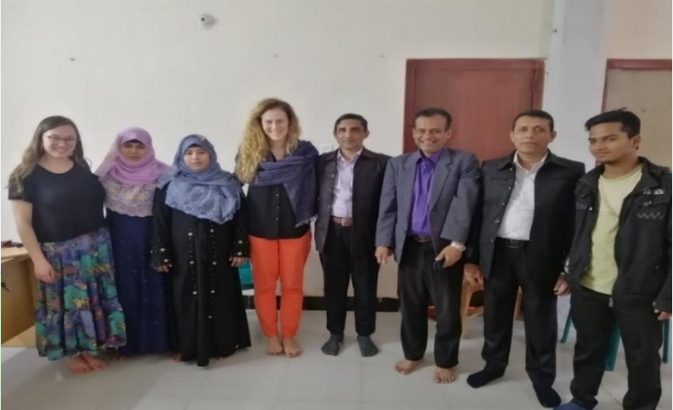
(ပုံ) အမေရိကန်နိုင်ငံ ဂျီနိုဆိုးဒ်ပြတိုက်၏ အကြီးအကဲများနှင့် ဘင်္ဂလားဒေ့ရှ်တွင် တွေ့ဆုံဆွေးနွေးစဉ်။ ၂၀၁၉၊ မတ်လ။