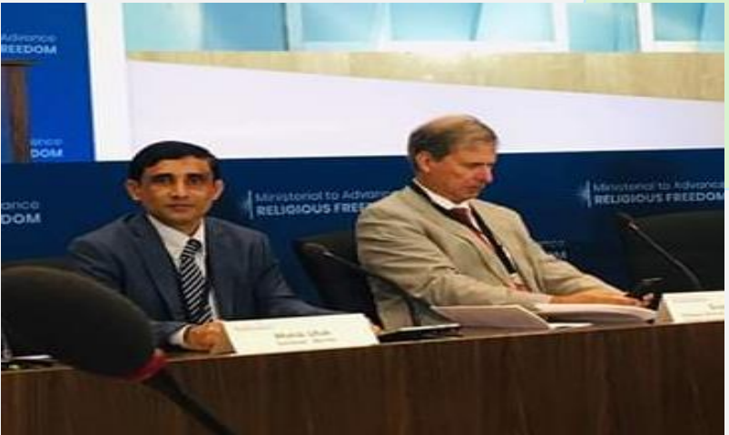
(ပုံ) အမေရိကန်နိုင်ငံ နိုင်ငံခြားရေးဝန်ကြီးအဆင့်၊ ဘာသာရေးလွတ်လပ်ခွင့် မြှင့်တင်ရေး တွေ့ဆုံဆွေးနွေးပွဲတွင် မိုဟမ်ဘူလ္လာကို တွေ့ရစဉ်။ ၂၀၁၉၊ ဇူလိုင်လ။