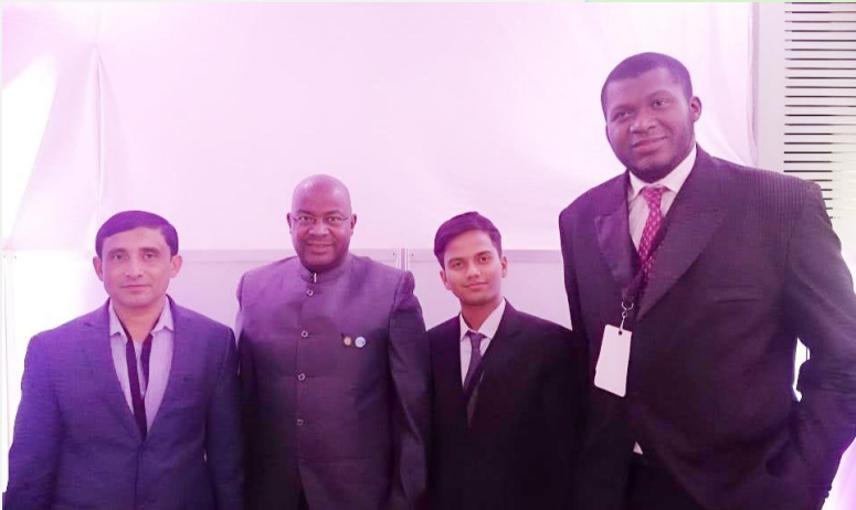
(ပုံ) ဂမ်ဘီယားနိုင်ငံခြားရေးဝန်ကြီးများနှင့်အတူ တွေ့ရသော မိုဟစ်ဘူလ္လာ။ ၂၀၁၉။