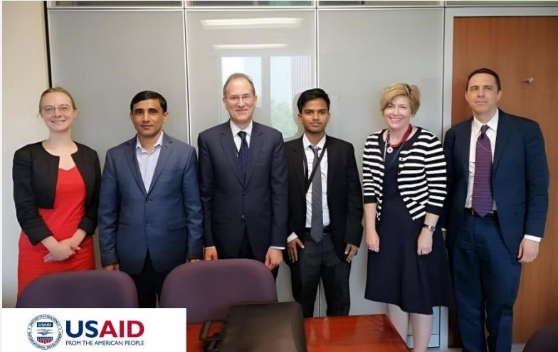
(ပုံ) US Agency for International Development ၏ တာဝန်ရှိသူများနှင့် ဝါရှင်တန်ဒီစီတွင် မိုဟင်ဘူလ္လာ တွေ့ဆုံစဉ်။