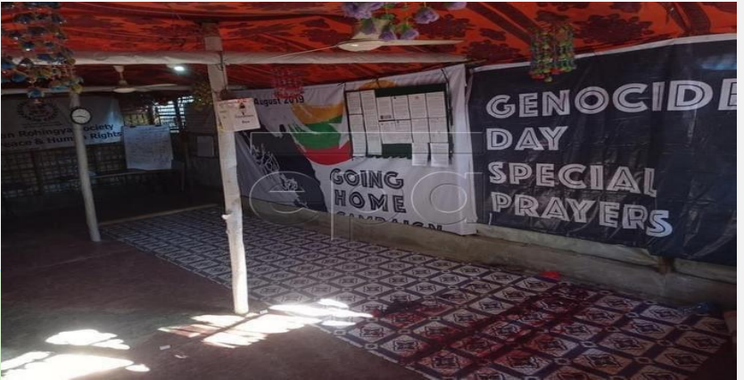
(ပုံ) မိုဟင်ဘုလ္လာကို လုပ်ကြံခဲ့သည့်နေရာတွင် သွေးယိုသွေးကျန်တွေ့ရပုံ။ ARSPH ရုံး။ ၂၀၂၁ ခု စက်တင်ဘာလ ၃၀ ရက်။