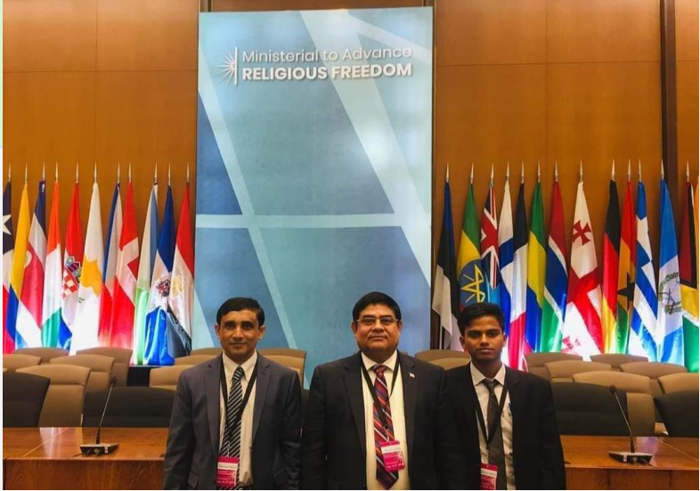
(ပုံ) အမေရိကန်နိုင်ငံ၊ ဝါရှင်တန်ဒီစီတွင် ပြည်သူ့လွှတ်တော်အမတ်ဟောင်း ဦးရွှေမောင် နှင့်အတူတွေ့ရစဉ်။ ၂၀၁၉။