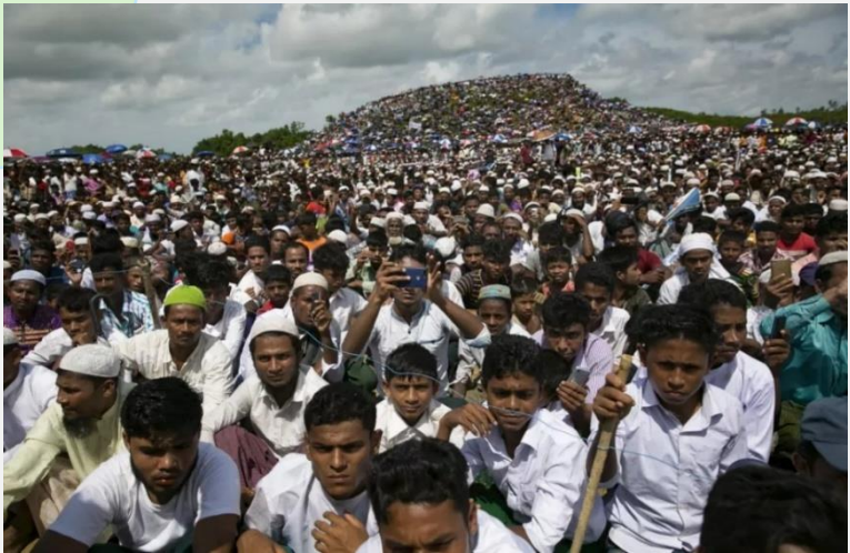
(ပုံ) ရိုဟင်ဂျာ လူမျိုးတုံးသတ်ဖြတ်မှု အောက်မေ့ဖွယ်အခမ်းအနားတွင် တက်ရောက်လာသော ဒုက္ခသည်များ မြင်ကွင်း။ ၂၀၁၉၊ ဩဂုတ်လ။