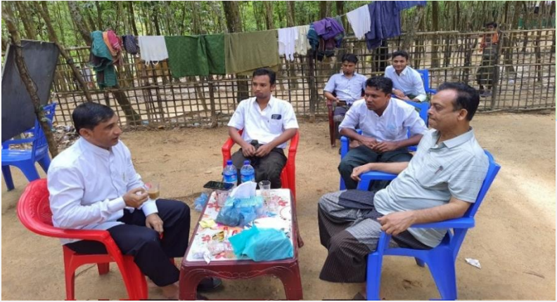
(ပုံ) မိုဟစ်ဘူလ္လာသည် ကာယာပူရိပညာရေးစင်တာတွင် ဆရာမိဘအသင်းနှင့် ဆွေးနွေးနေစဉ်။ ၂၀၁၉။