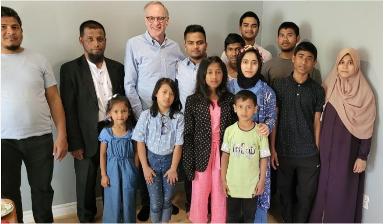
(ပုံ) ကနေဒါနိုင်ငံသို့ ရောက်ရှိနေသော မိုဟင်ဘူလ္လာ၏ မိသားစုနှင့် ကနေဒါနိုင်ငံခြားရေး ဝန်ကြီးဌာန အတွင်းဝန် ရော့ဘ်အော်လီဖန်နှင့်အတူ တွေ့ရစဉ်။