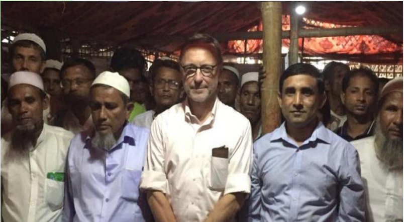
(ပုံ) ရှေးဒန်နိုင်ငံဆိုင်ရာ နယ်သာလန်သံအမတ်ကြီး Harry Verweij သည် ARSPH ရုံးသို့ လာရောက်တွေ့ဆုံစဉ်။ ၂၀၁၉၊ စက်တင်ဘာ။