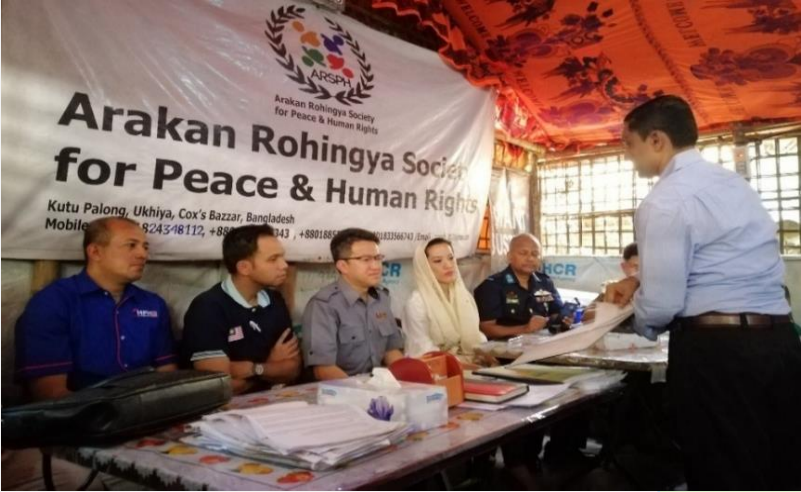
(ပုံ) မလေးရှားနိုင်ငံ ဒုကာကွယ်ရေးဝန်ကြီး လျူချင်တောင်ဂီ ဦးဆောင်သောအဖွဲ့နှင့် ARSPH ရုံးတွင် တွေ့ဆုံဆွေးနွေးနေစဉ်။ ၂၀၁၉၊ မတ်လ။