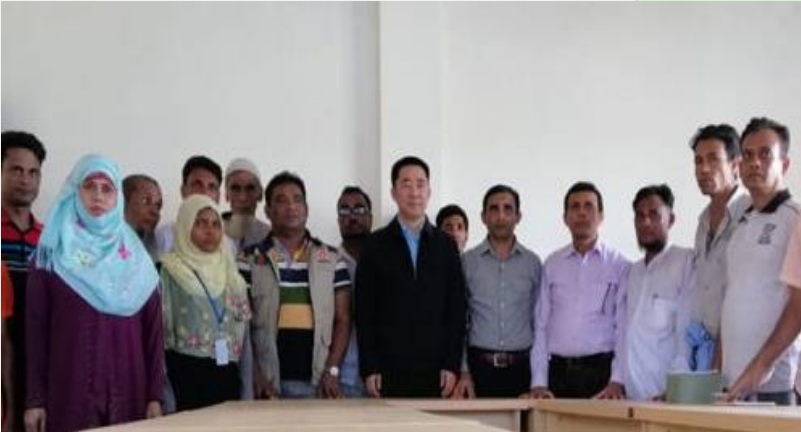
(ပုံ) ဘင်္ဂလားဒေ့ရှ်နိုင်ငံ တရုတ်နိုင်ငံသံအမတ်ကြီး ဂျာန်ဇူနှင့် မိုဟင်ဘူလ္လာ ဦးဆောင်သော အဖွဲ့နှင့် တွေ့ဆုံဆွေးနွေးပြီး အမှတ်တရ ရိုက်ကူးထားသော ဓာတ်ပုံ။ ၂၀၁၉၊ မတ်လ။