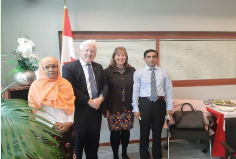
(ပုံ) ကနေဒါနိုင်ငံ လွတ်တော်အမတ် ဘော့ရဲနှင့်အတူ ဒေါ်ဟာမီဒါခါတွန်း၊ မိုဟင်ဘူလ္လာတို့ ဝါရှင်တန်ဒီစီ၌ တွေ့ဆုံစဉ်။ ၂၀၁၉၊ ဇူလိုင်လ။