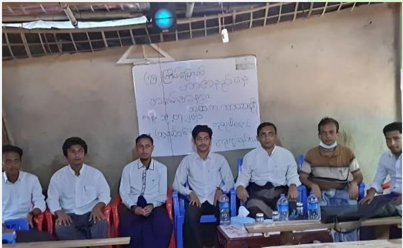
(ပုံ) ၂၀၂၀ ခု ဇူလိုင်လ ၁၉ ရက်တွင် ကာယာပူရီအထက်တန်းကျောင်း၌ ကျင်းပခဲ့သော ၇၅ ကြိမ်မြောက် အာဇာနည်နေ့အခမ်းအနား၌ မှီဟစ်ဘူလ္လာကို တွေ့ရစဉ်။ ၂၀၂၀။