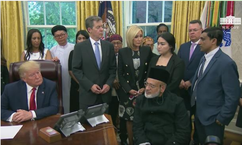
(ပုံ) အမေရိကန်နိုင်ငံ၊ အိမ်ဖြူတော် အိုဘဲလ်ခန်းတွင် သမ္မတ Donald Trumpနှင့် တွေ့ဆုံ မေးမြန်းနေစဉ်။ ၂၀၁၉၊ ဇူလိုင်လ။

လူ့အခွင့်အရေးလှုပ်ရှားသည့် အဖွဲ့အစည်းများဖြစ်သော Fortify Rights၊ Amnesty International ၊ Human Rights Watch စသော အဖွဲ့အစည်းများ၏ အကြီးအကဲများနှင့်လည်း မကြာခဏ ဆက်သွယ်ဆွေးနွေးကာ စခန်းအတွင်း လူ့အခွင့်အရေး ချိုးဖောက်ခံရမှုများ၊ မြန်မာနိုင်ငံအတွင်း ဖြစ်ပွားလျက်ရှိသည့် စစ်တပ်၏ အဓမ္မကွင်းဆက်များကို တင်ပြပေးလေ့ရှိခဲ့သည်။