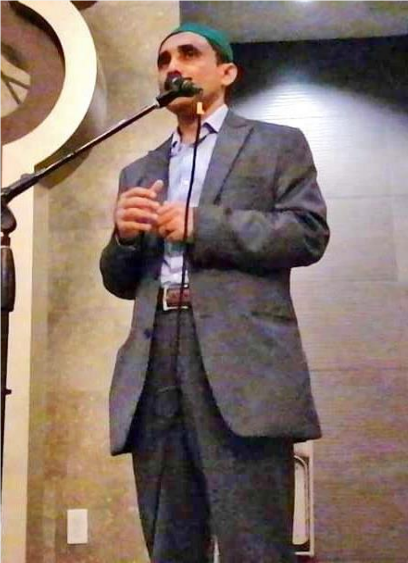
(ပုံ) မိုဟစ်ဘူလ္လာသည် အမေရိကန်နိုင်ငံ၊ မွတ်စလင်ကွန်မြူနီတီနှင့် တွေ့ဆုံ၍ ရိုဟင်ဂျာအရေး ရှင်းလင်းနေစဉ်။ ၂၀၁၉။